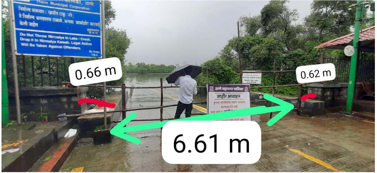
Site Location - Kopri Ganesh Visarjan Ghat