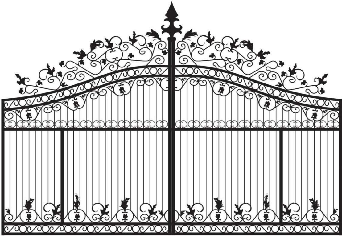
Design for reference